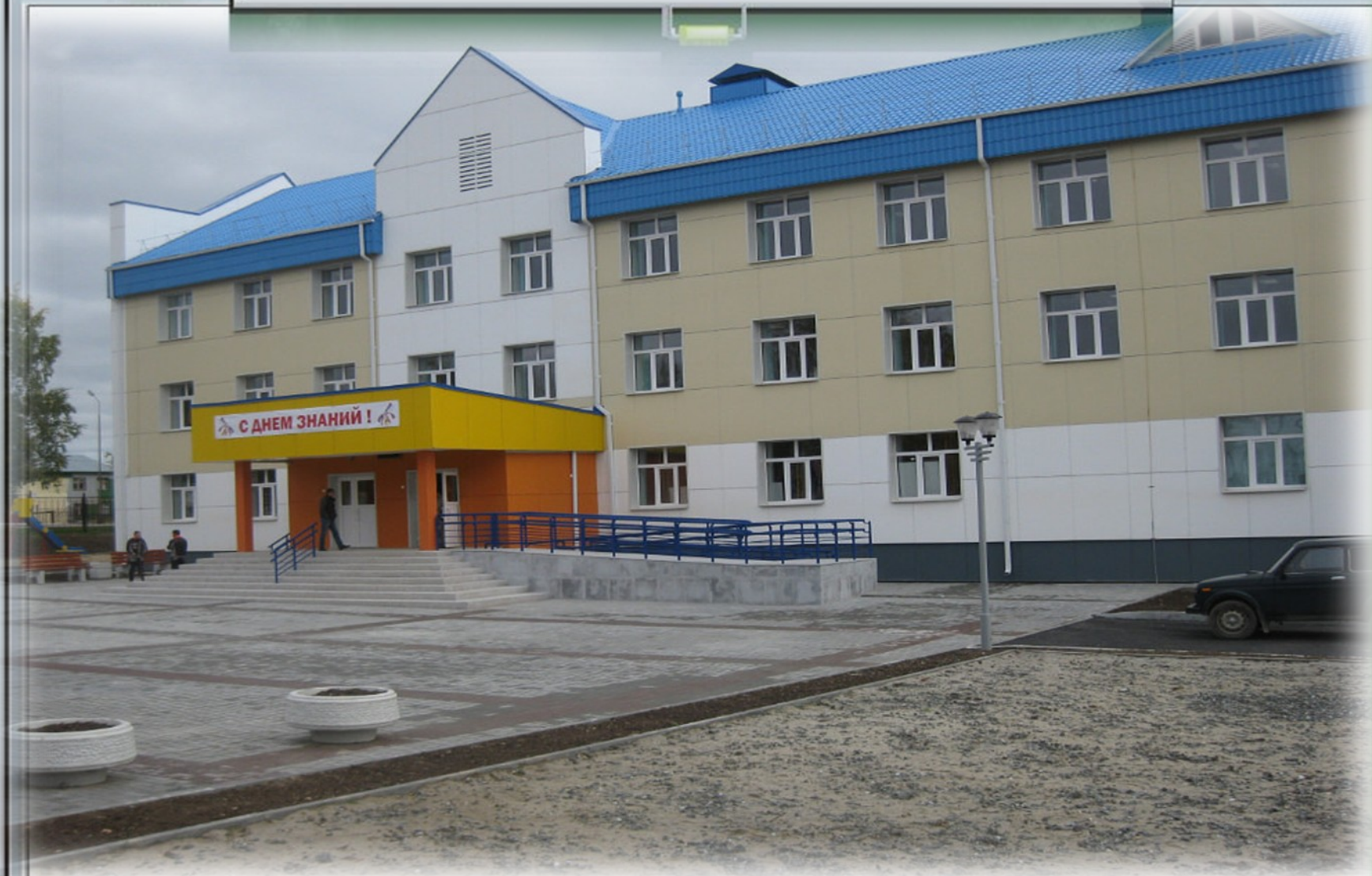
МБОУ «Октябрьская СОШ им. Н.В. Архангельского»